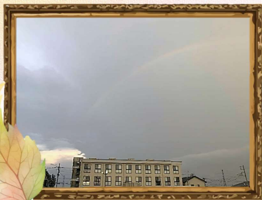
グラントホーム箕輪の頭上に虹が

台風により多大な被害を及ぼしたと連日ニュース番組で放送されておりました。ご災難に遭われました皆様に心よりお見舞い申し上げます、一日も早い復興をお祈りしております。こちら箕郷では大きな虹が見られました。虹は幸運の前兆とも言われます。このダブルレインボーが皆様におかれましても吉報となりますように。